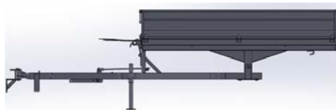
Slika 1. 3 D model traktorske prikolice

Nakon što su sagledani svi tehnički zahtjevi traktorske prikolice nosivosti 1 t, tim za razvoj pristupio je izradi 3D modela prikolice.