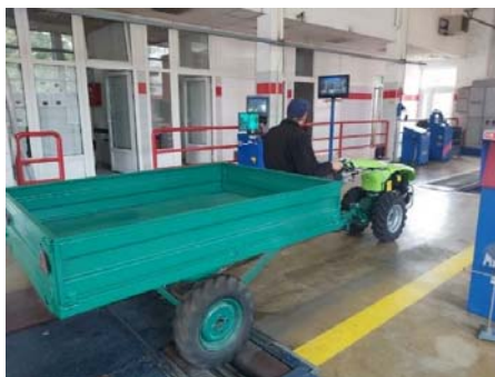
Slika 4. Ispitivanje kočionih cilindara i sila kočenja prikolice