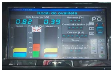
Slika 3. Rezultati hidraulične prikolice