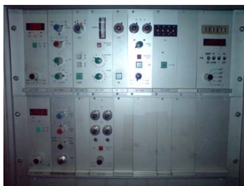
Slika 2. Upravljački ormarić VF pulzatora

VF pulzator se ranije kalibrisao prema standardu BAS EN ISO 7500-1:2005 [1], koji je podrazumijevao statičku kalibraciju odnosno kalibraciju \sigma_{sr}/F_{sr} . Usvajanjem novog standarda ISO 4965:2005 [2] promijenjeni su zahtjevi za kalibraciju, tako da se osim srednjih napona i sila ( \sigma_{sr} , F_{sr} ) moraju kalibrirati i amplitudni naponi, odnosno sile ( \sigma_a , F_a ).