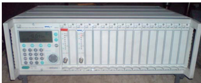
Slika 5. Modularni uređaj za mjerenje HBM MGCplus

Na slici 5 je prikazan uređaj korišten za kalibraciju VF pulzatora, odnosno za registraciju izmjerenih veličina s pretvarača za silu..