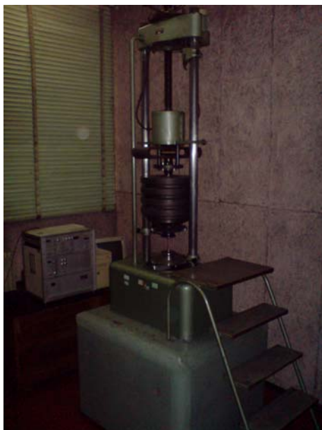
Slika 1. Izgled VF pulzatora 10 HFP 422

VF pulzator za dinamička ispitivanja 10 HFP 422 (Slika 1, Slika 2) služi za određivanje dinamičke čvrstoće pri opterećivanju zatezanjem, pritiskivanjem, zatezanjem i pritiskivanjem, savijanjem i uvijanjem, kako na sobnim temperaturama tako i na povišenim temperaturama. Na ovom pulzatoru se može odrediti dinamička čvrstoća cijelih konstrukcionih dijelova ako ne izlaze izvan definisanih performansi mašine. Frekvencije ispitivanja koje se koriste za ispitivanja u zavisnosti od opterećenja su date u Tabeli 1.