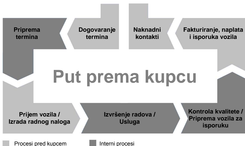
Slika 1. Model osnovnog servisnog procesa

Svi vlasnici motornih vozila su svjesni da je njihova vozila potrebno redovito održavati pridržavajući se tvornički propisanih intervala održavanja, ali prilikom svog dolaska u servis oni imaju svoje zahtjeve i očekivanja po pitanju kvalitete. S druge strane, tehnološki proces koji se odvija u servisu ima svoja pravila. Sva događanja u servisu predstavljaju veoma kompleksnu suradnju ljudi, alata i informacijskih sustava. U ovom takozvanom "području sukoba" između zahtjeva kupaca s jedne strane i poslovanja i ekonomičnosti servisa s druge strane potrebno je etablirati optimalni osnovni servisni proces kao upravljački instrument. On treba biti posrednik pri spajanju potreba kupaca i zahtjeva servisa, pa se stoga može kazati da je servisni proces ustvari "put prema kupcu" [5]. Na slici 1 prikazan je model optimalnog osnovnog servisnog procesa održavanja motornih vozila, primjenom kojeg je osigurana kvaliteta servisa.