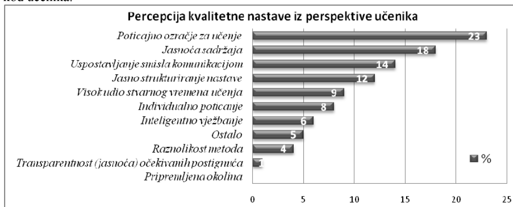
Slika 2. Hijerarhija obilježja kvalitetne nastave po zastupljenosti u definicijama učenika

Kada se ovi rezultati poredaju po vrijednostima dobija se hijerarhija obilježja kvalitetne nastave kod učenika.