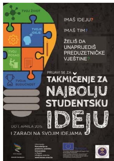
Slika 4. Plakat za takmičenje

Imajući u vidu da će osnova za ocjenjivanje i rangiranje ideja biti biznis plan, da bi svi učesnici imali istu podršku u toku takmičenja, start-up obuke koje realizuju poslovni inkubatori na WBCInno projektu (BIC, BINS, BITF, ICBL, BIPG) će biti unificirane, i obuhvatit će četiri modula: Razvoj poslovnog modela, Validacija poslovnog modela, Finansiranje start-up preduzeća, Kratke usmene prezentacije ('elevator pitch').