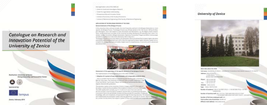
Slika 1. Katalog istraživačkog i inovacionog potencijala UNZE

Centar za inovativnost i preduzetništvo su predstavili svoje područje rada, osnovne reference, projekte na kojima su učestvovali ili učestvuju, opremu koju koriste i sl. Navedeni katalog, izveden na bosanskom i engleskom jeziku predstavlja odličan način predstavljanja naučno-istraživačkog rada i potencijala Univerzitetima u Zenici sadašnjim i budućim partnerima iz akademskog i poslovnog svijeta.