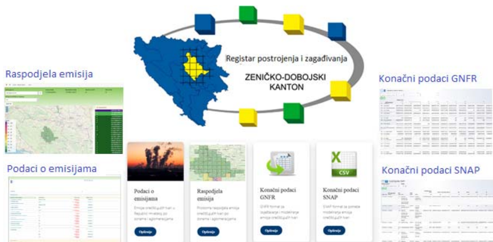
Slika 2. Web portal za pristupanje aplikacijama i objavu informacija iz baze Registra

Svi podaci u bazi su javno dostupni te stoga ne postoje podaci koji su dostupni samo pojedinim skupinama korisnika. Osnovni podaci dostupni u aplikaciji su: